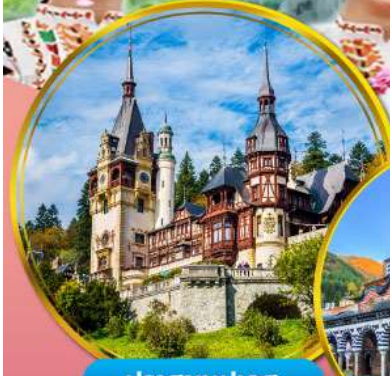
ปราสาทเปเลส