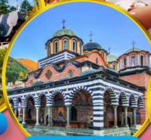
อารามมรดกโลกริลา