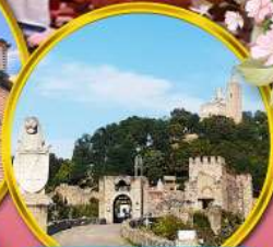
ป้อมชาเรเวทส์