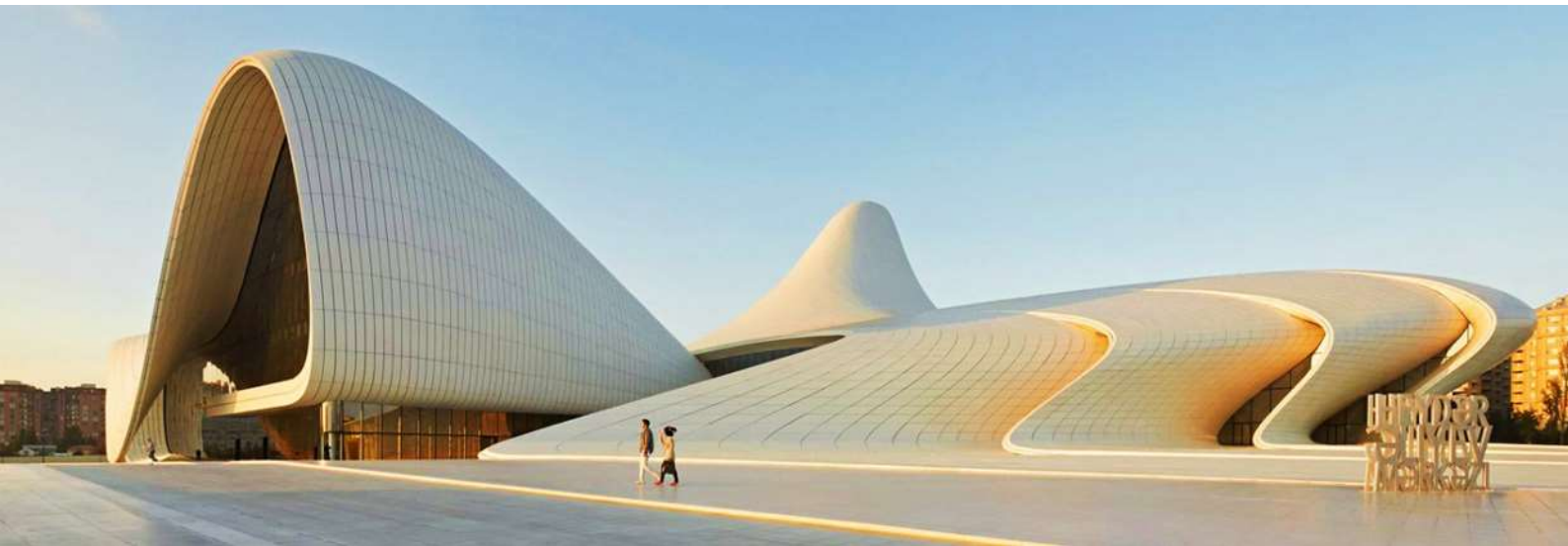
นำท่านแวะถ่ายรูป ศูนย์ศิลปะไฮดา อาลียอฟ (HEYDAR ALIYEV CENTER) สถาปัตยกรรมล้ำค่าของประเทศ อาเซอร์ไบจานที่มีรูปทรงทันสมัยแบบ MODERN-ABSTRACT