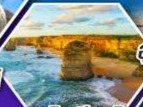
อุทยานบลูเมาส์แท่น