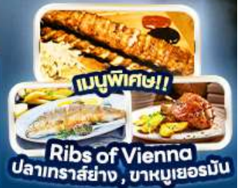
เมนูพิเศษ!! Ribs of Vienna ปลาเทราสย่าง, บาหมูเยอร์มัน