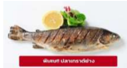
พิเศษ! ปลาเทราต์ย่าง

เย็น ๑๐ รับประทานอาหารเย็น (มื้อที่4) ที่พัก : Gartenhotel Maria Theresia Hall หรือโรงแรมและเมืองระดับใกล้เคียงกัน (ชื่อโรงแรมที่ท่านพัก ทางบริษัทจะทำการแจ้งพร้อมใบนัดหมาย 5-7 วัน ก่อนวันเดินทาง)