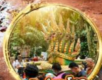
ป่าคำชะโนด